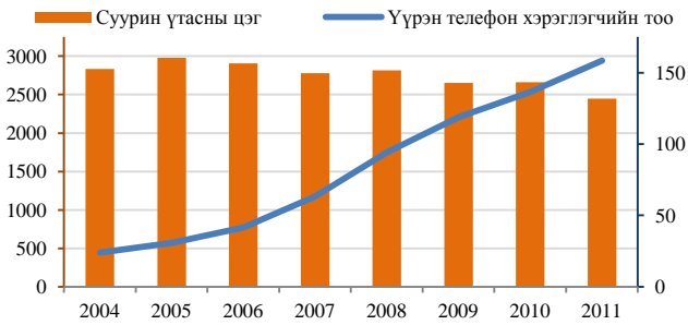
Суурин холбооны хэрэглэгчдийн зах зээлд эзлэх хувь 2011 он